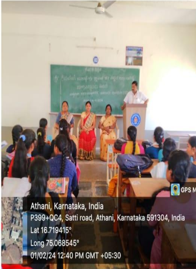
Athani, Karnataka, India P399+QC4, Satti road, Athani, Karnataka 591304, India Lat 16.719415° Long 75.068545° 01/02/24 12:40 PM GMT +05:30