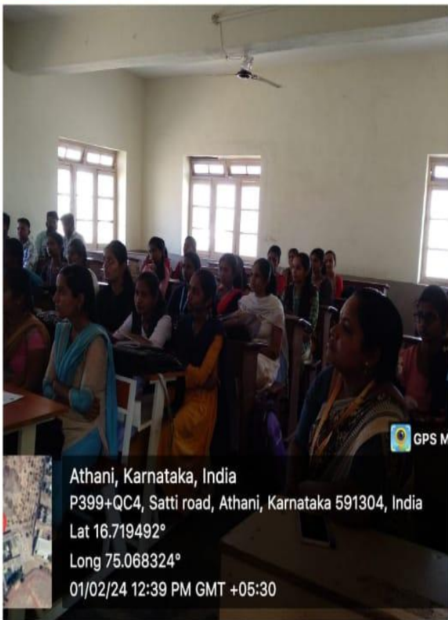
Athani, Karnataka, India P399+QC4, Satti road, Athani, Karnataka 591304, India Lat 16.719492° Long 75.068324° 01/02/24 12:39 PM GMT +05:30