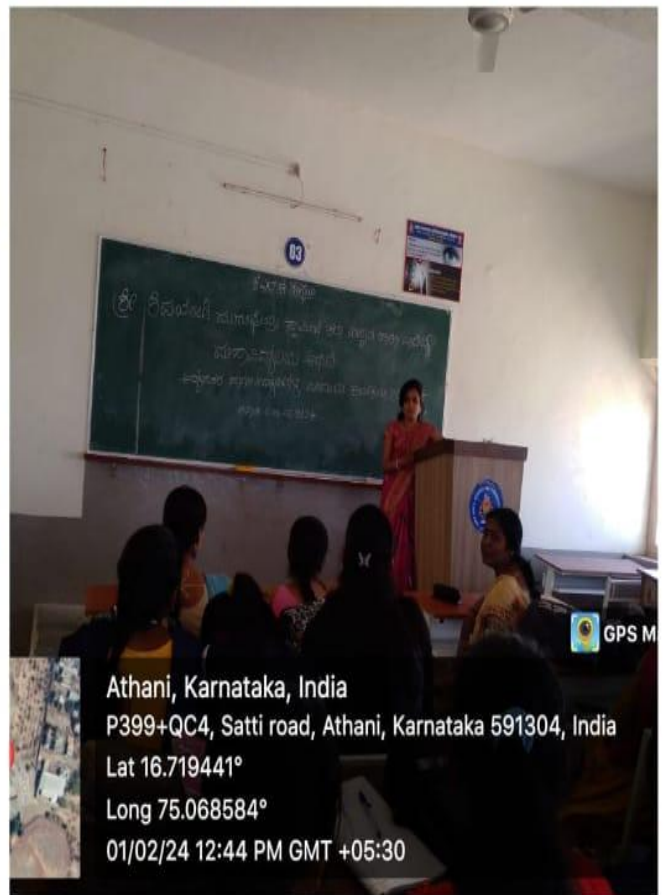
Athani, Karnataka, India P399+QC4, Satti road, Athani, Karnataka 591304, India Lat 16.719441° Long 75.068584° 01/02/24 12:44 PM GMT +05:30