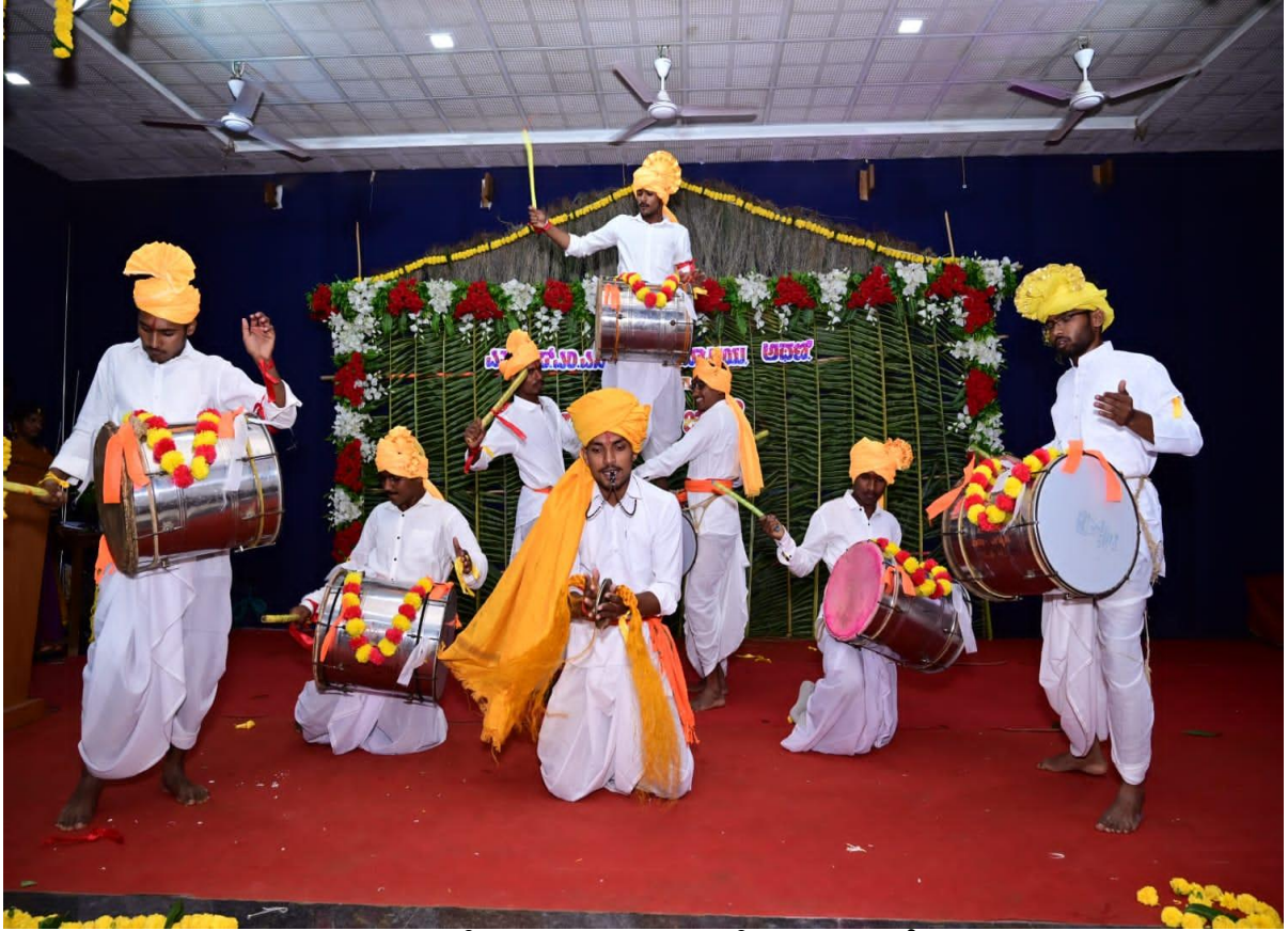
ವಿದ್ಯಾರ್ಥಿಗಳಿಂದ ಜನಪದ ಕಲೆಗಳ ಪ್ರದರ್ಶನ ಡೊಳ್ಳು ಕುಣಿತ