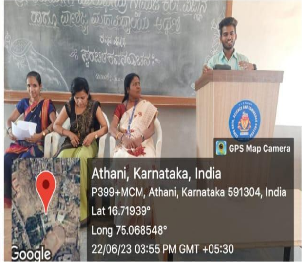
Athani, Karnataka, India P399+MCM, Athani, Karnataka 591304, India Lat 16.71939° Long 75.068548° 22/06/23 03:55 PM GMT +05:30