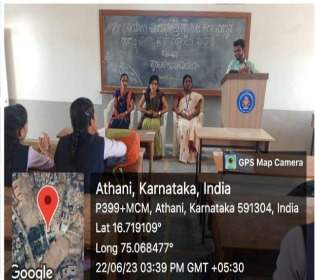
Athani, Karnataka, India P399+MCM, Athani, Karnataka 591304, India Lat 16.719109° Long 75.068477° 22/06/23 03:39 PM GMT +05:30