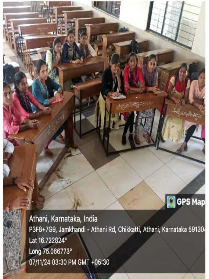
Athani, Karnataka, India P3F8+7G9, Jamkhandi - Athani Rd, Chikkatti, Athani, Karnataka 591304 Lat 16.722824° Long 75.066773° 07/11/24 03:30 PM GMT +05:30