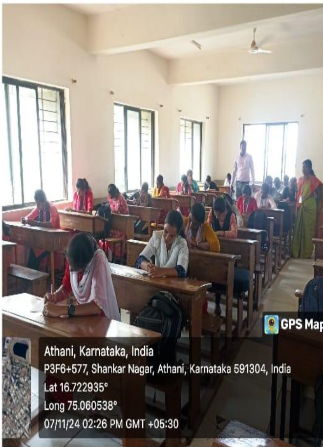
Athani, Karnataka, India P3F6+577, Shankar Nagar, Athani, Karnataka 591304, India Lat 16.722935° Long 75.060538° 07/11/24 02:26 PM GMT +05:30