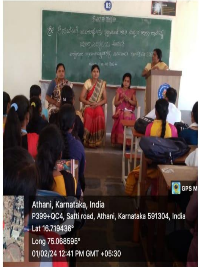
Athani, Karnataka, India P399+QC4, Satti road, Athani, Karnataka 591304, India Lat 16.719436° Long 75.068595° 01/02/24 12:41 PM GMT +05:30