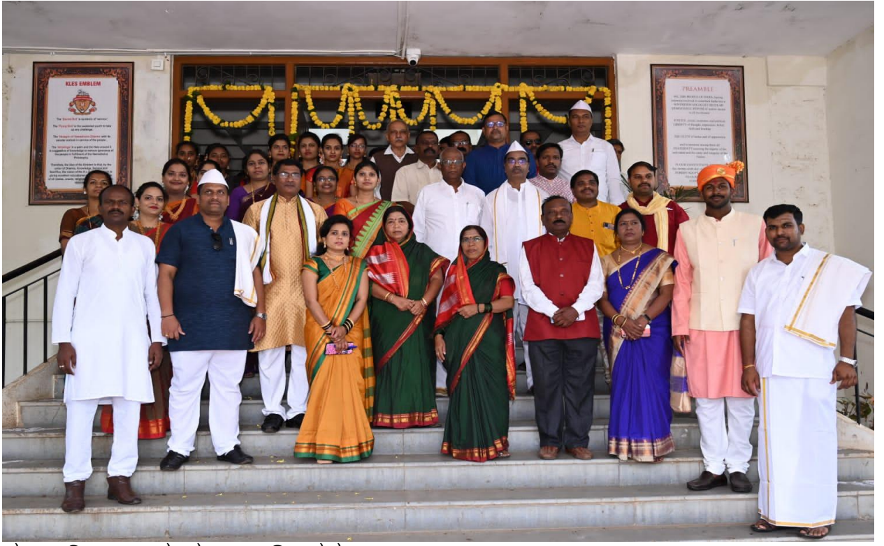
ಮಹಾವಿದ್ಯಾಲಯದ ಸಿಬ್ಬಂದಿ ವರ್ಗ