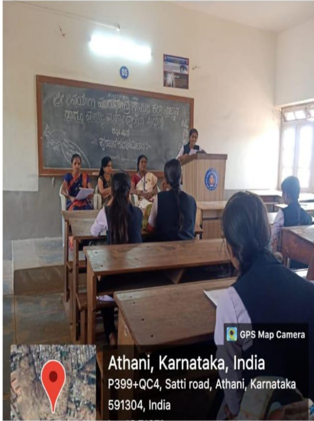
Athani, Karnataka, India P399+QC4, Satti road, Athani, Karnataka 591304, India