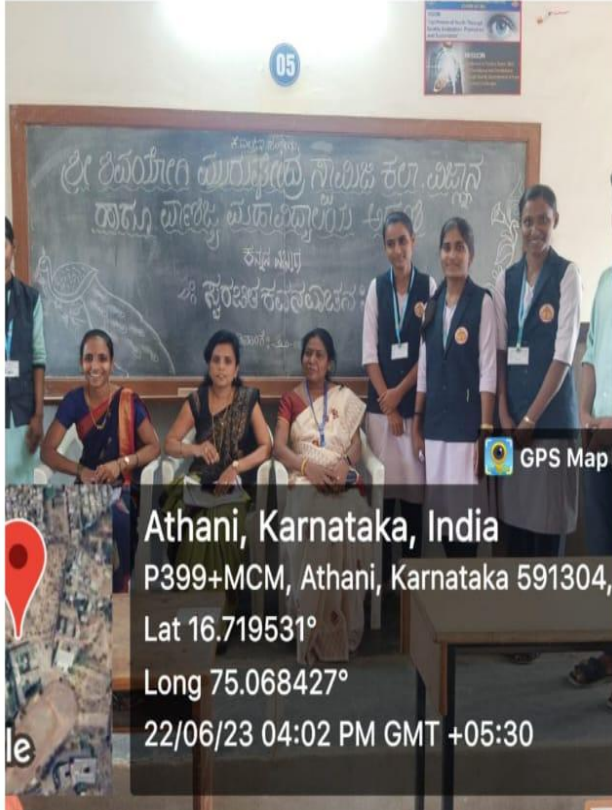
Athani, Karnataka, India P399+MCM, Athani, Karnataka 591304, Lat 16.719531° Long 75.068427° 22/06/23 04:02 PM GMT +05:30