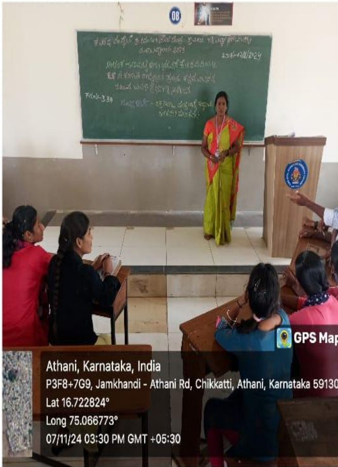
Athani, Karnataka, India P3F8+7G9, Jamkhandi - Athani Rd, Chikkatti, Athani, Karnataka 591304 Lat 16.722824° Long 75.066773° 07/11/24 03:30 PM GMT +05:30