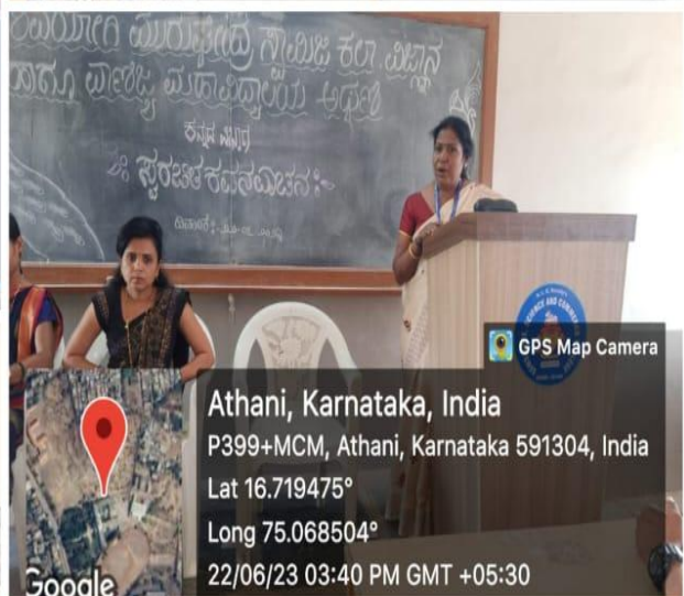
Athani, Karnataka, India P399+MCM, Athani, Karnataka 591304, India Lat 16.719475° Long 75.068504° 22/06/23 03:40 PM GMT +05:30